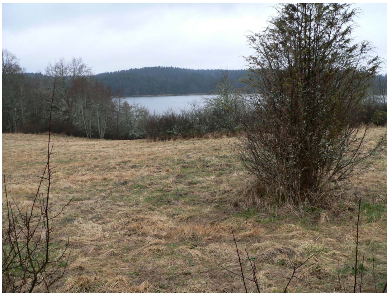
Foto som är taget inom norra delen av planområdet och mot Gropviken

Detaljplan för del av Arentorp 5:1, Björnvik, Sankt Anna, Söderköpings kommun, Östergötlands län