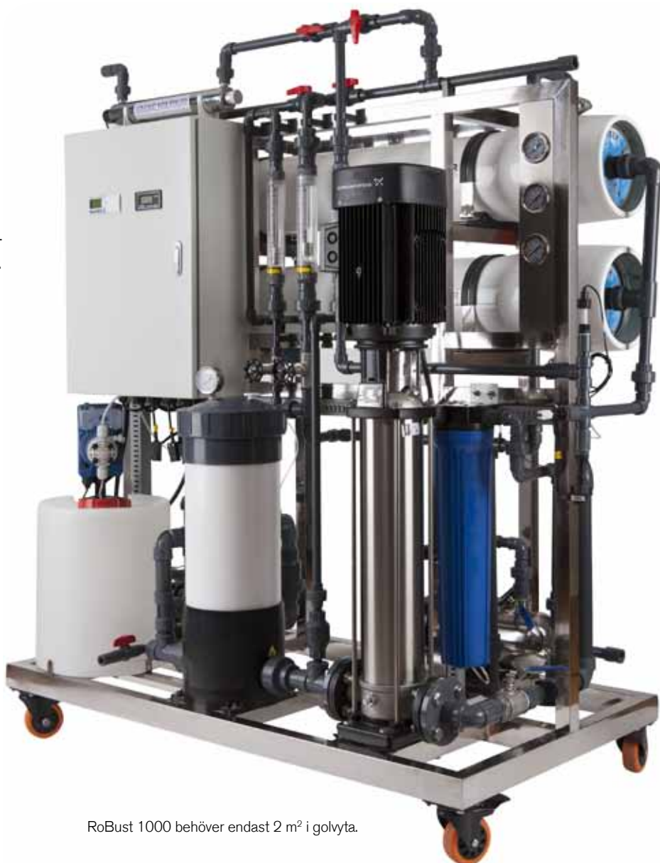
RoBust 1000 behöver endast 2 m 2 i golvyta.

Alla avsaltningsanläggningar bör årligen tvätta sina membran för att bibehålla sin produktionskapacitet. Med CIP - Clean In Place - vår inbyggda funktion för effektiv membrantvätt, då membranerna sitter kvar på plats utförs detta både snabbt och enkelt.