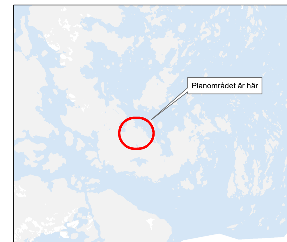
Orienteringskarta - Norra Finnö