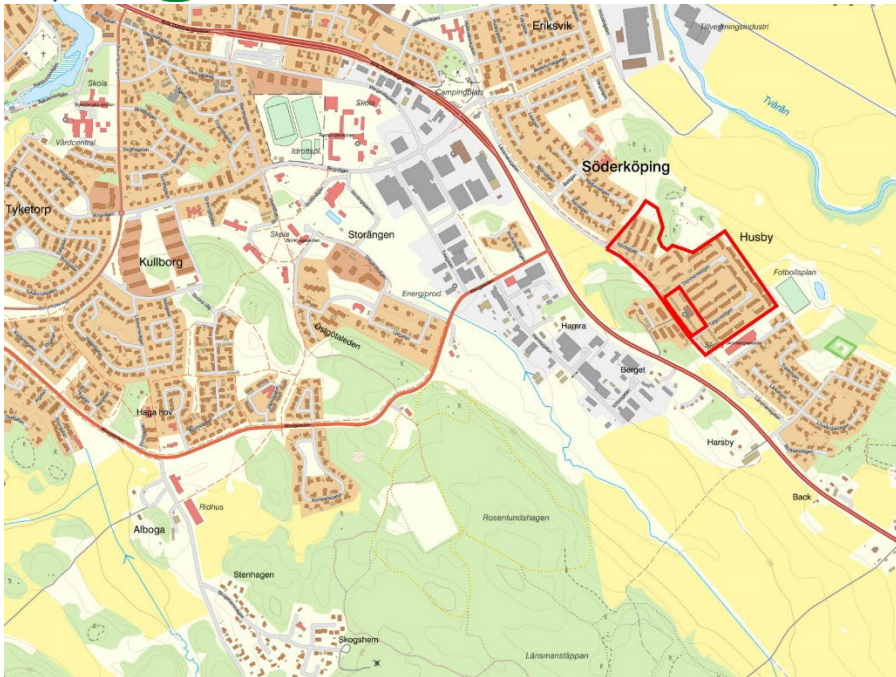
Figur 2: Översiktskarta med planområde markerat i rött.