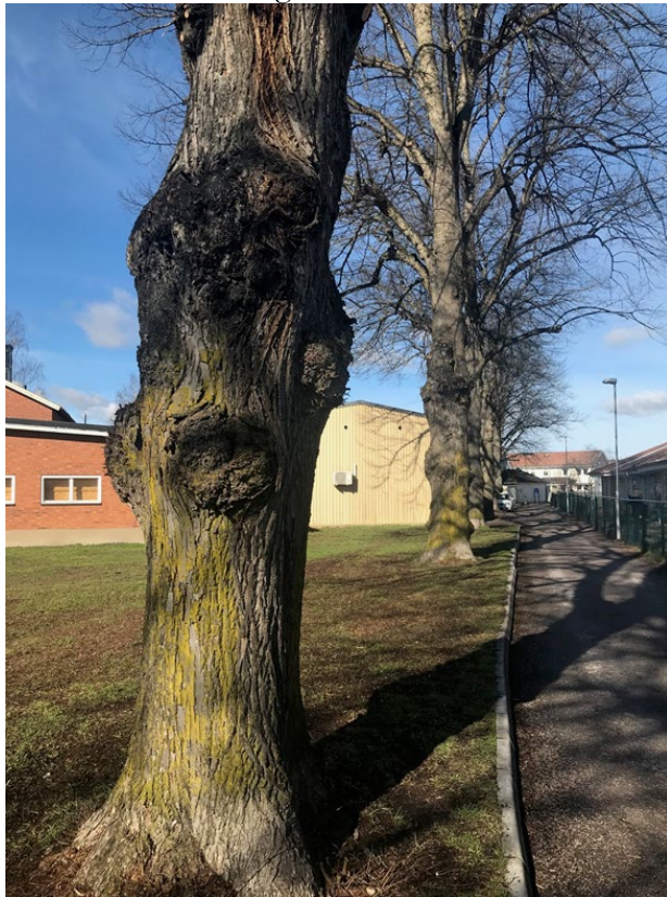
Bild 2. Träden som förekommer i allen