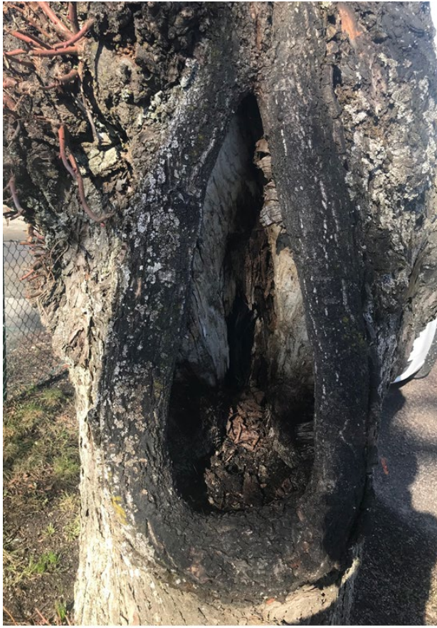
Bild 1. lind med hålighet