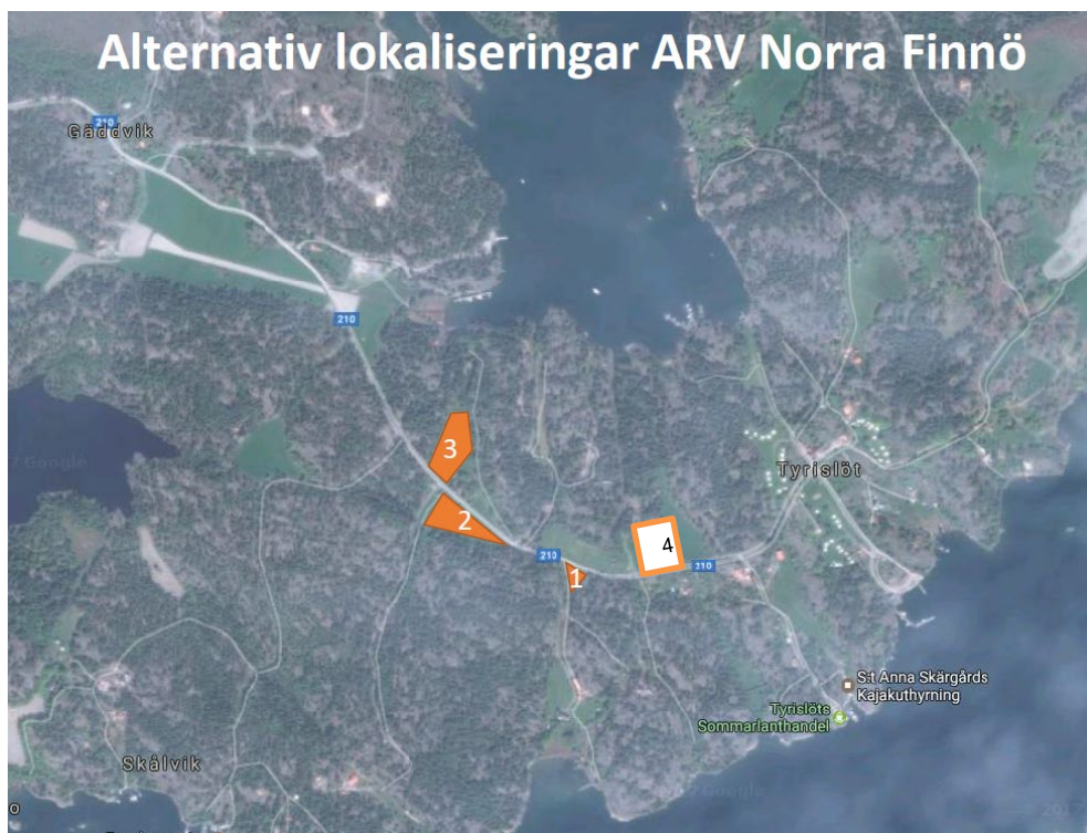
Studerade alternativa lokaliseringar.

Inför ansökan om planuppdrag studerades fyra olika lokaliseringalternativ. Alla alternativen är placerade längs befintligt ledningsnät och ger alltså samma möjlighet att använda tidigare ledningsdragningar. Nedan följer en redovisning av de olika alternativens förutsättningar som har legat till grund för det förslag som detaljplanen innebär.